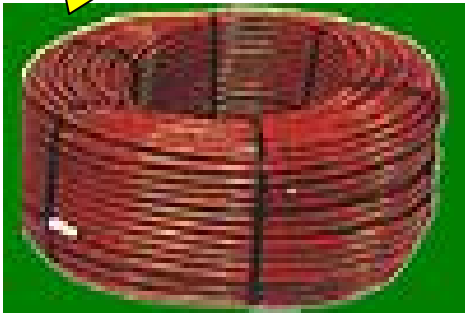
Couronne de 25 m goutteurs