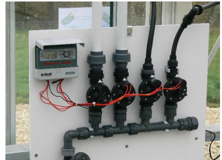
Programmateur 4 voies + électrovannes + nourrice (option programmeur livré avec 1 nourrice 2 voies et 1 électrovanne)