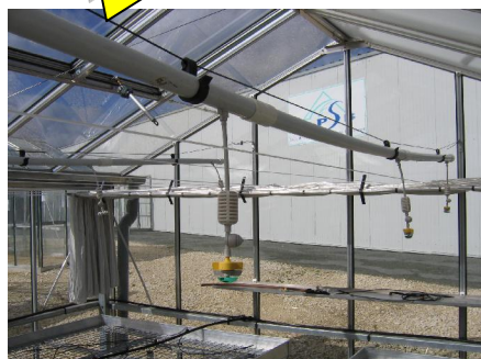
Rampe d'aspersion (gouttes)